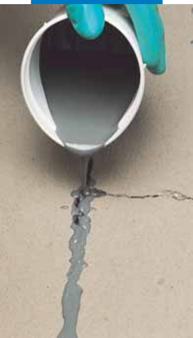
Repararea unei fisuri la o șapă pe bază de ciment folosind Eporip