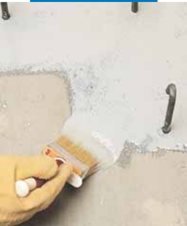
Aplicarea Eporip prin pensulare la un rost de turnare